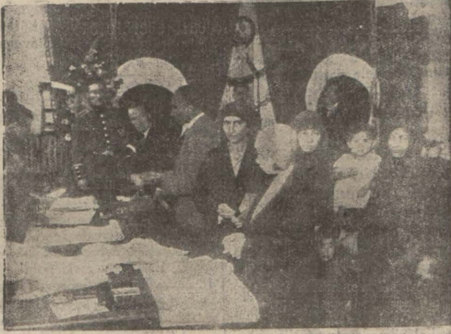
Kadıköyde Sandığa Rey Atanlar