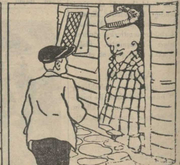
1 : Hasan B. — Gel bakalım “kitmir”! al şu lokmayı!