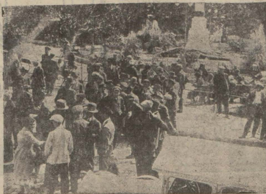
Fatihte Belediyenin Dışında Bekliyen Halk